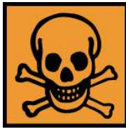
T - Toxique