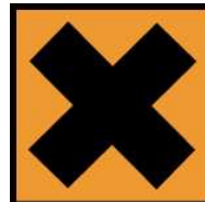
Xn - Nocif